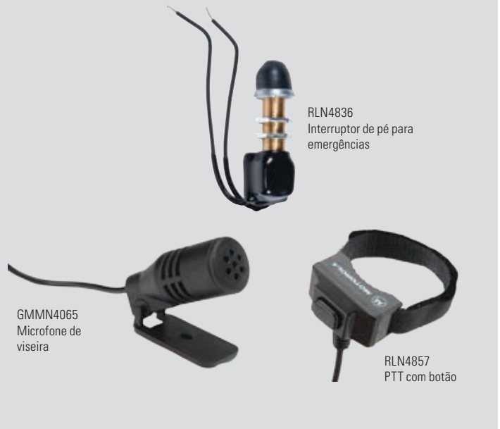
RLN4836 Interruptor de pé para emergências