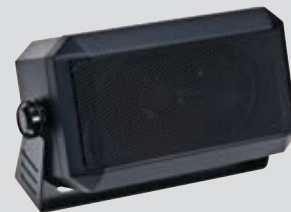
RSN4001 Alto-falante externo de 13W