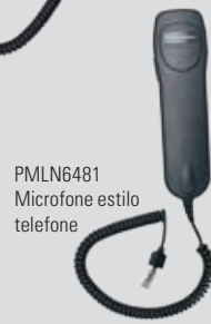
PMLN6481 Microfone estilo telefone